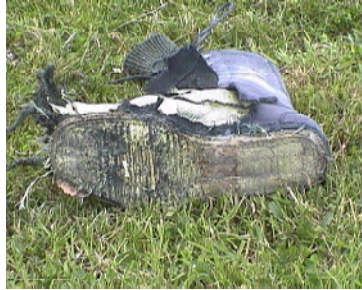
حذاء "بي أف أر" بعد انفجار 50 غ من المتفجرات عند الضربة