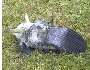
حذاء "بي أف أر" بعد انفجار 70 غ من المتفجرات عند الكعب